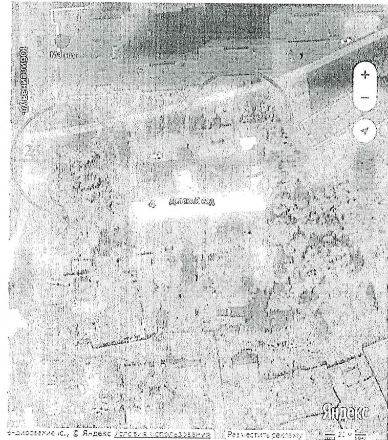
Схема границы прилегающей территории к муниципальному дошкольному образовательному учреждению детский сад общеразвивающего вида с приоритетным осуществлением художественно-эстетического развития воспитанников п. Каменники (Рыбинский район, Каменниковское СП, п. Каменники, ул. Юбилейная, д.4)

● - ориентир входа в магазин «Магнит» (АО «Тандер») по адресу: Ярославская область, Рыбинский район, Каменниковское СП, п.Каменники, ул.Юбилейная, д.6